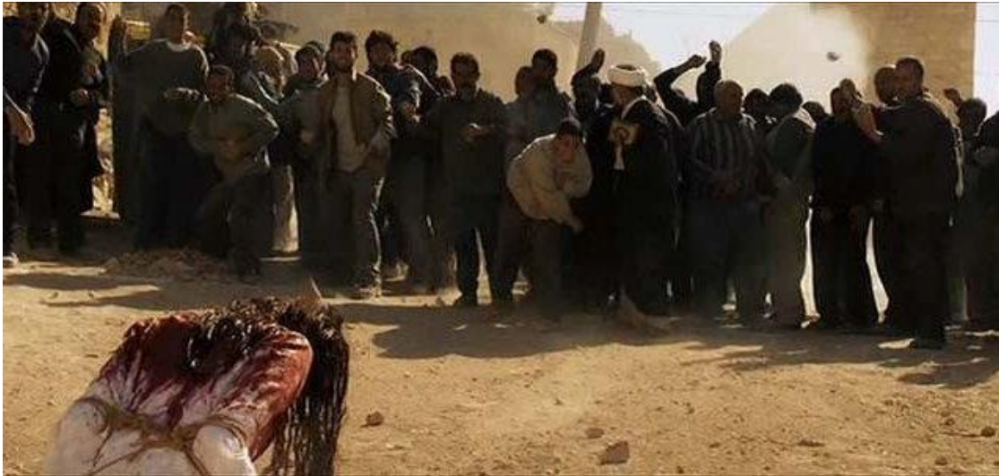
De Islamitische Staat die een slachtoffer stenigt in naam van Allah (God)

vakgebied nauwkeurig opvolgt. Wat betekent dat de hersenwetenschap aan het eeuwenoude debat over het bestaan van God en de waarde van religie wordt toegevoegd! Kunnen de politieke partijen en religieuze groeperingen de hedendaagse wetenschappelijke inzichten gebruiken om de overtuigingen van anderen te beïnvloeden? De wetenschappers zijn als groep steeds meer open voor ideeën over religie en spiritualiteit? Het Pew Forum nodigde Dr Newberg en de heer Brooks uit om deze vragen te stellen en hun inzichten met de journalisten te delen die in Key West (US) waar ze samen kwamen om erover te debatteren.