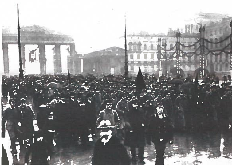
«Les Socialistes belges 1885-1918».